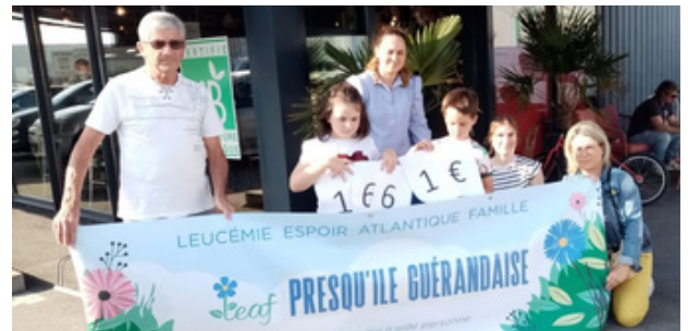
Remise d'un chèque des Artisans du Pain