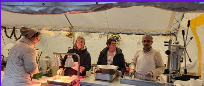
Vente de chichis sur le Noël Magique de La Baule avec les Lions Côte d'Amour